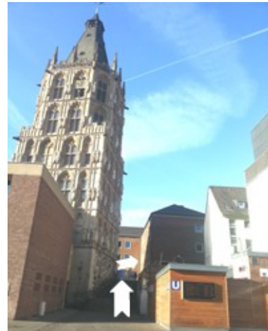
Anreise mit U-Bahn (Linie 5)